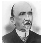
Carlo LORENZINI alias COLLODI (1826-1890)