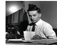
Dino BUZZATI (1906-1972)