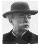
Edmondo De AMICIS (1846-1908)