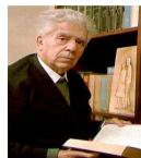
Eugenio MONTALE (1896-1981)